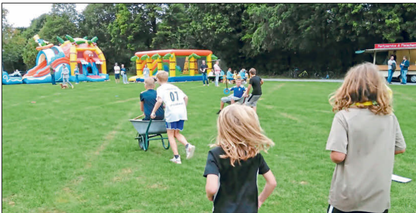
Acht Teams mit jeweils vier bis fünf Kindern gingen beim Sommerfest in Herbram an den Start.