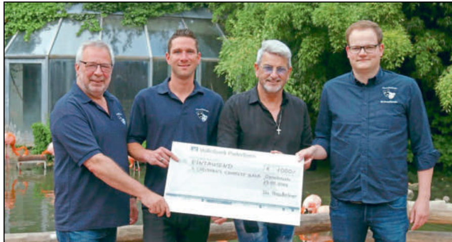
1000 Euro kamen bei der Spendenaktion zusammen.