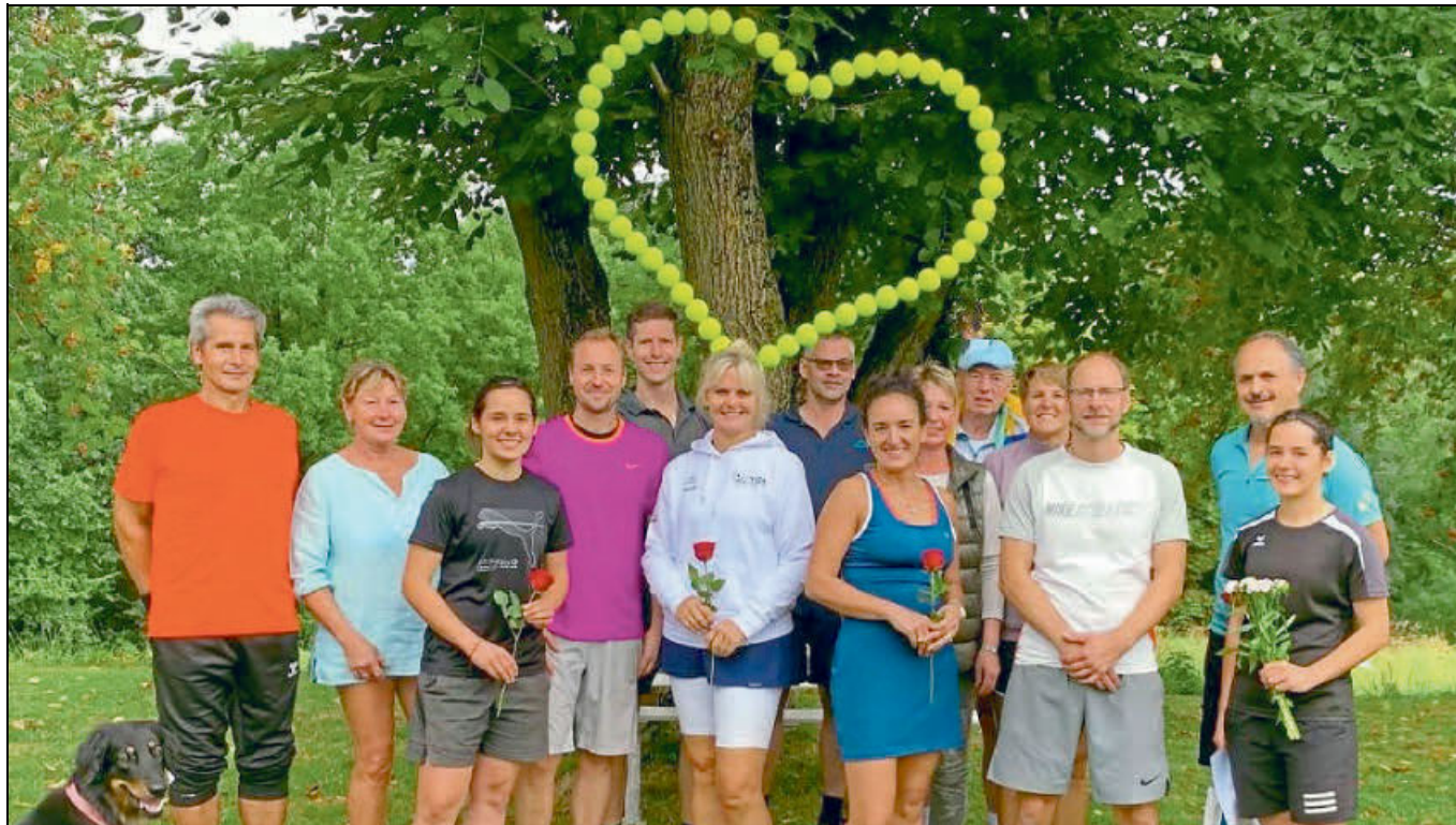
Mit viel Herz und Eifer waren die Mitglieder vom TC Lichtenau bei der Sache.