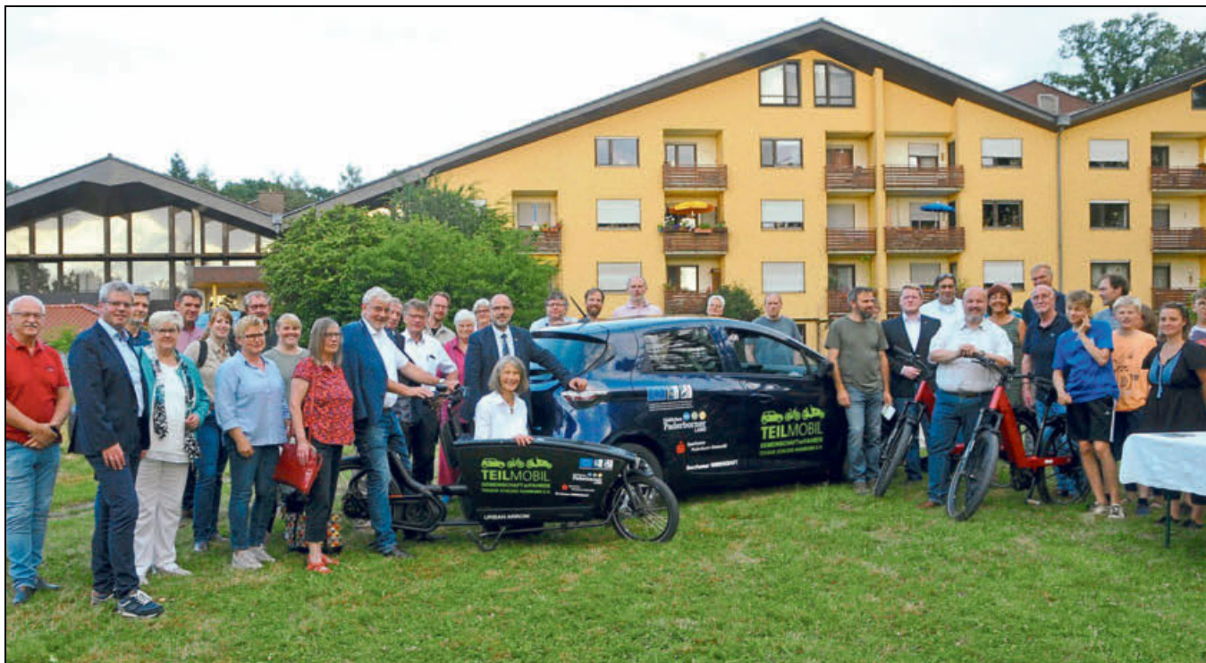
Mitglieder der Lokalen Aktionsgruppe der LEADER-Region und des Projektträgers Teilbar Schloss Hamborn e.V. bei der Vorstellung des Projektes in Schloss Hamborn.