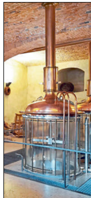
Der Braukessel steht schon bereit.

Weitere Informationen und Anmeldung finden Interessierte im Internet unter der Adresse www.stiftung-kloster-dalheim.lwl.org oder per Telefon unter der Rufnummer 05292/9319225, die dienstags bis freitags von 10 bis 16 Uhr besetzt ist.