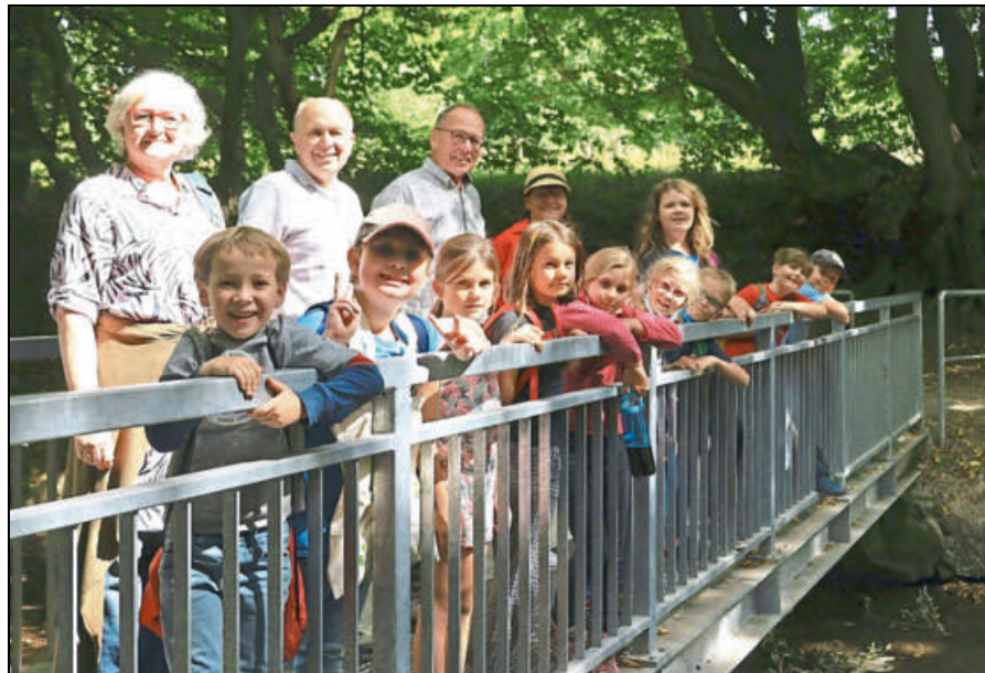
Die Naturstrolche während der Wanderung mit dem Landrat.

Besuchen von auf dem Biohof, wo die Kinder im Schafstall, bei Hühnern, Ziegen und Kühen unter fachkundiger Führung auf Tuchfühlung mit der Landwirtschaft gehen können. Andere Routen führen an die Sauer, oder ins Eselsbett, wo sich natürliche Lebensräume erkunden lassen. Im Garten der OGS übt man sich im Anbau von Gemüse, im Bau von Hühnerhäusern, oder