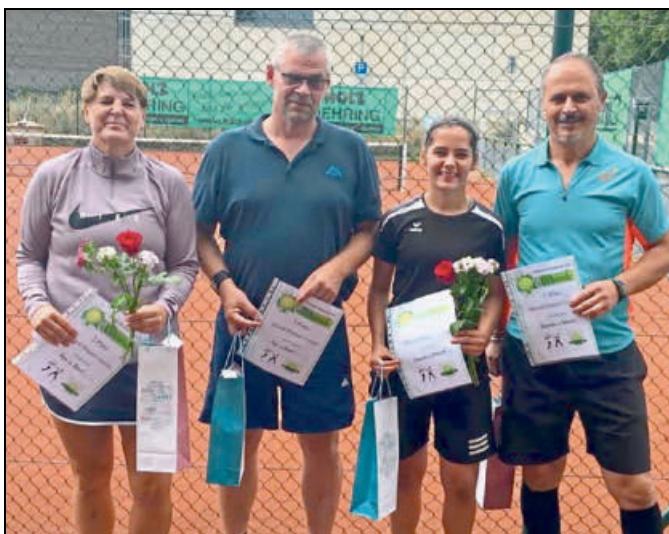
Die siegreichen Duos des Mix-Doppel-Wettbewerbs.

Dann folgte der gemütliche Teil. Es wurde gemeinsam gegessen, Geschichten aus dem Sommer erzählt und so manche Zukunftsvision angesprochen.