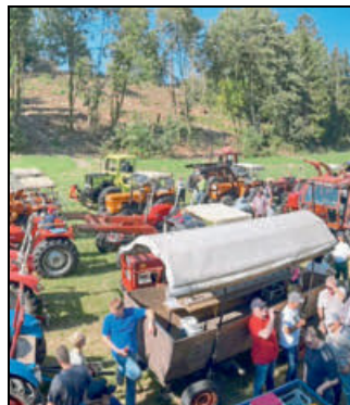
Die Schlepper bei der Pause während der Rundfahrt.