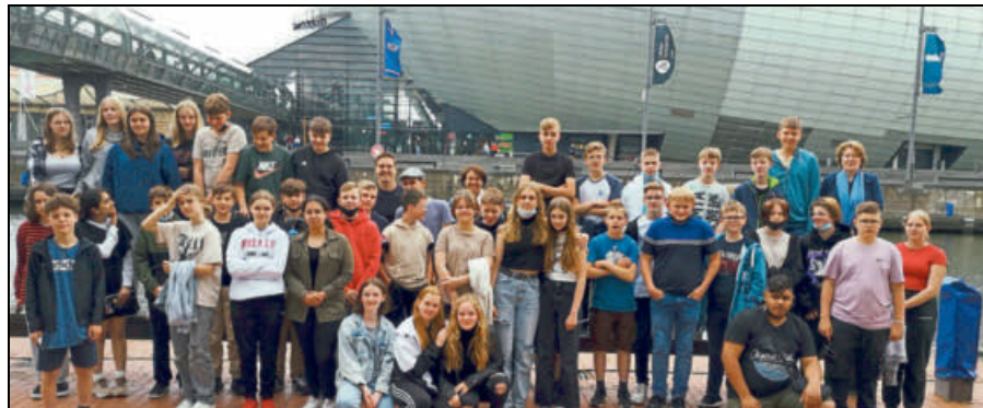
Die Klassen vor dem Klimahaus in Bremerhaven.

Am zweiten Tag der Klassenfahrt stand nach eingehender Erkundung