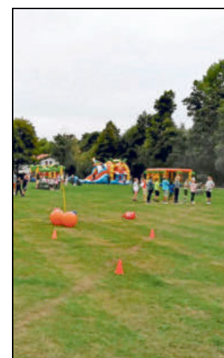
Es gab eine Vielzahl von tollen Spielen.

Abgerundet wurde der Tag durch reichlich Rahmenprogramm. Der Herbramer Kindergarten „Pepino“ schminkte Kinder und hatte eine Buttonstation organisiert. Austoben konnten sich alle auch noch in gleich drei Hüpfburgen.